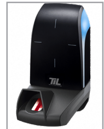
Mit Zusatzlesegerät erhältlich: biometrisch, QR-Code oder 125 kHz